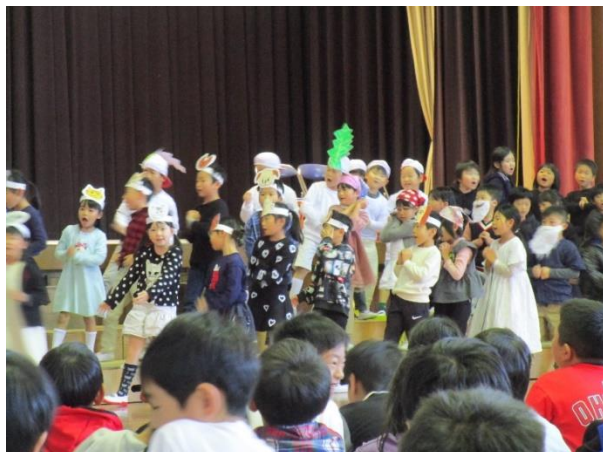
1年生 劇「おおきな かぶ」

学習発表会や文化祭の様子は、ホームページにも掲載させていただいています。日頃の子どもたちの様子も載せていますので、みてください。