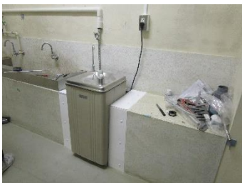
かい きゅうすいしつ 1階 かい 給 きゅう 水 すい 室 しつ