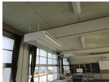
りかしつ 理 り 科 か 室 しつ