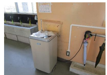
かい ねんせいきょうしつまえ 3階 かい 5年 ねん 生 せい 教 きょう 室 しつ 前 まえ