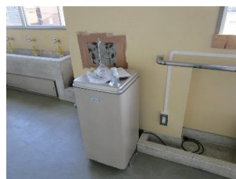
かい ねんせいきょうしつまえ 4階 かい 4年 ねん 生 せい 教 きょう 室 しつ 前 まえ